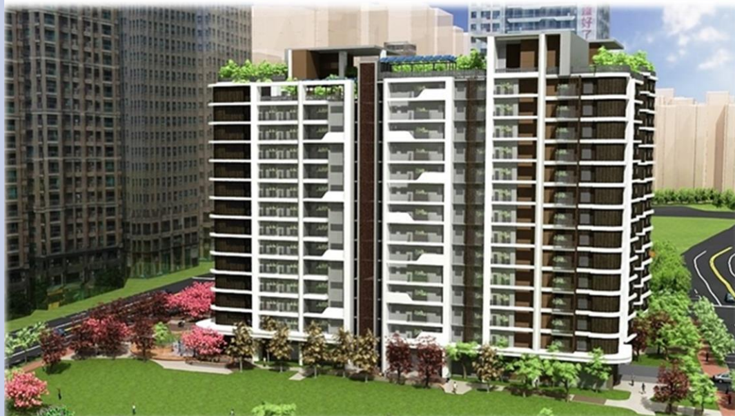
建築及設施工程類