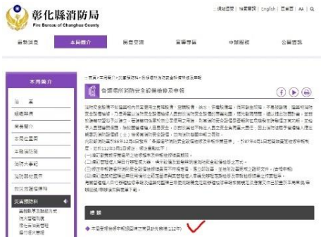
中高火災地區消防設備圖說申請常見缺失態樣(112年)

針對審查結果一次告知消防設備師(士)，業者亦能透過資訊公開方式得知被退件原因，降低被陳情檢舉機率；另推廣消防安全設備圖說審查及建築物消防安全竣工查驗線上申辦及進度查詢功能，使審查期程透明，杜絕不法設備師(士)及相關公務人員「上下其手」之機會。